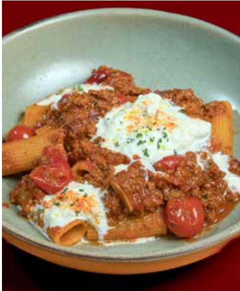
Rigatoni Bolognese 320 tube pasta with beef sauce, Stracciatella cheese & a touch of dried chili

ริกาโทนี โบโลเนส พาสต้าริกาโทนีซอสเนื้อ ชีสตราเซียเตลลา และพริกแห้ง