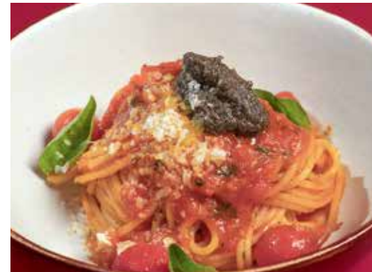
Spaghetti Pomodoro 260 cooked with rich tomato sauce, basil leaves, garlic & olive tapenade

สปาเกตตีผัดพริกกระเทียมน้ำมันมะกอก กระเทียม น้ำมันมะกอก เบคอน พริก และอิตาเลียนพาร์สลีย์