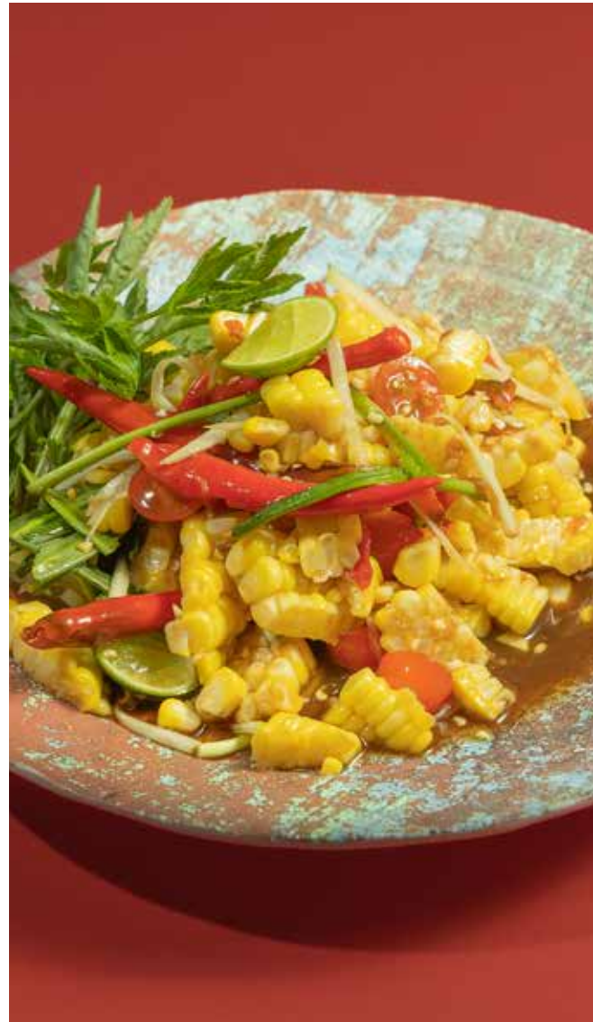
Som Tum Corn ส้มตำข้าวโพด