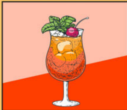
Mai Tai 380

Dry Gin, Vodka, Rum, Tequila, Cointreau, Lemon Juice, Syrup, Cola