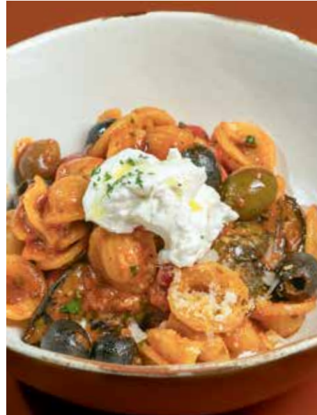
Orecchiette Puttanesca 320 mixed olives, capers, anchovy, tomato, grilled eggplant, dried chili, oregano & Ricotta cheese

ริกาโทนี โบโลเนส พาสต้าริกาโทนีซอสเนื้อ ชีสตราเซียเตลลา และพริกแห้ง