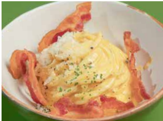
Spaghetti Carbonara Romana 300 egg yolk, Pecorino cheese and bacon

โอเรคคิเอตเต พุกทาเนสซ่า มะกอก เคเปอร์เบอร์รี่ แอนโชวี มะเขือเทศ มะเขือม่วงย่าง พริกแห้ง ออริกาโน่ และชีสริคอตต้า