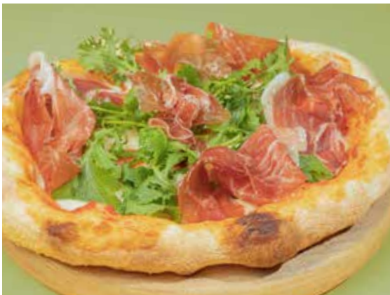
Prosciutto 480 Parma ham & green leaves โปรซุตโตและพาร์มาแฮม เสิร์ฟพร้อมผักใบเขียว