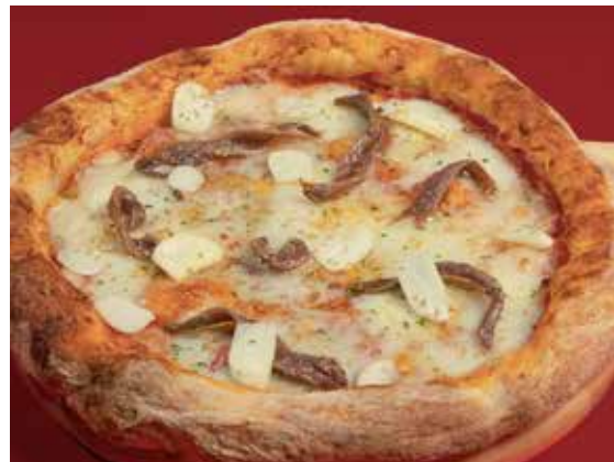
Marinara 350 tomato Pomodoro, garlic, anchovy & oregano พิซซ่ามารินารา มะเขือเทศโพโมโดโร กระเทียม แอนโธวี และออริกาโน่