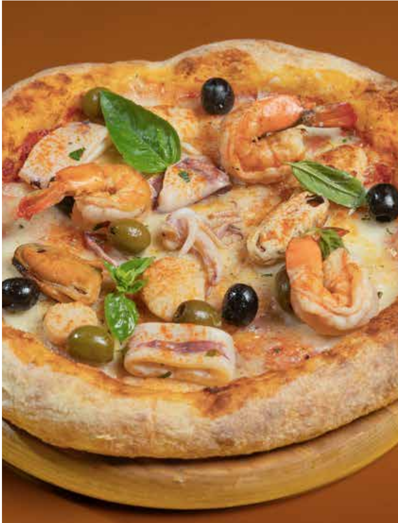
Fruitti de Mare 480 mixed seafood, olives & paprika พิซซ่าซีฟู้ด ซีฟู้ดรวมสโตนเมดิเตอร์เรเนียน มะกอก และปาปริก้า