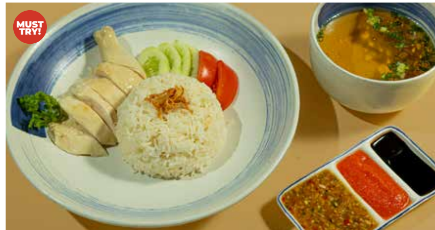
Hainanese Chicken Rice served with soy bean sauce, chili sauce & dark soy sauce

ข้าวมันไก่ไหหนาน เสิร์ฟพร้อมน้ำจิ้ม 3 ชนิด สามารถเลือกเป็นอกไก่หรือสะโพกไก่