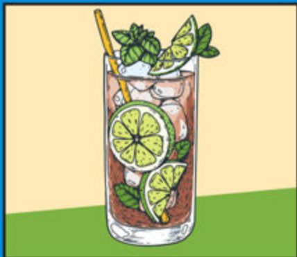
Long Island Ice Tea 360

Bourbon, Angostura Bitters, Sugar Cube, Soda