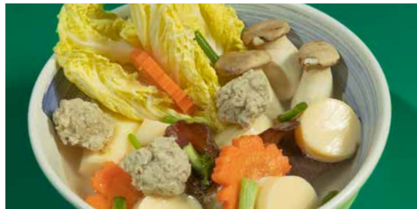
Clear Broth 280 with minced pork ball, assorted vegetables, wood ear mushroom & tofu แกงจืดหมูสับ ผักรวม เห็ดหูหนู และเต้าหู้