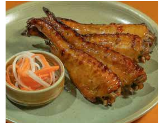
Grilled Smoky Chicken Wings 200 with pickled green papaya