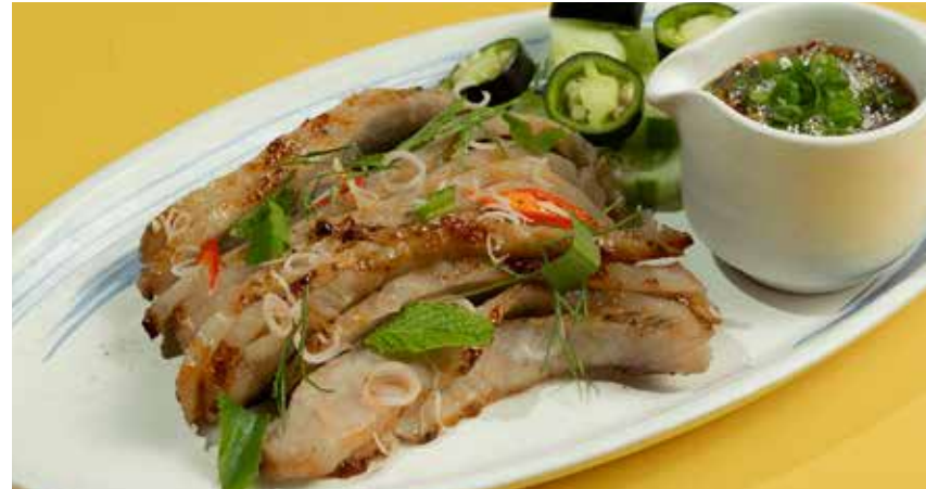
Grilled Pork Jowls

served with purple chili, cucumber & jeow tamarind