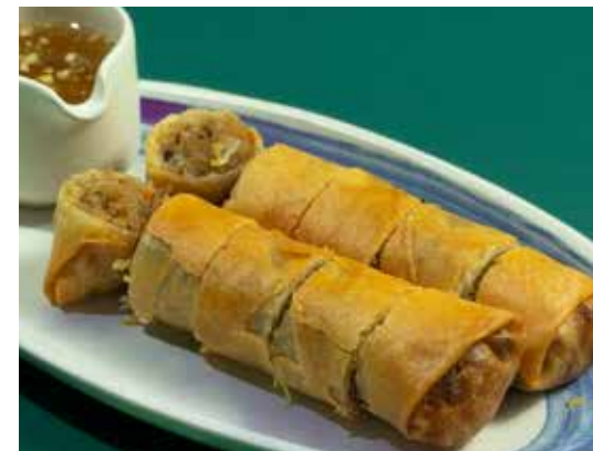
Deep - Fried Homemade Glass Noodle & Pork Spring Roll