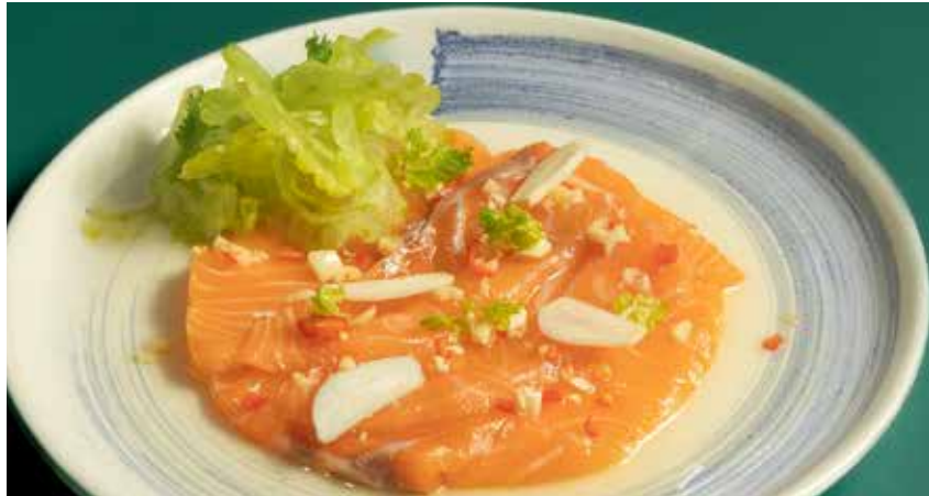
Salmon & Bitter Gourd Marinated with fish sauce, garlic, chili and lime