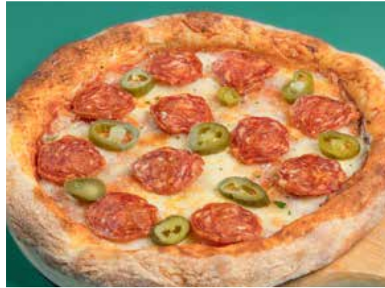
Diavola 450 spicy pepperoni salami, Jalapeno chili พิซซ่าดีอาโวล่า ซาลามิรสเผ็ด และพริกฮาลาปิโญ