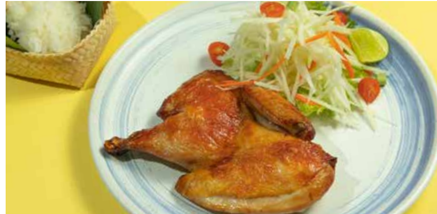
Grilled Organic Chicken served with Thai papaya salad & sticky rice

ไก่ออร์แกนิกย่าง ครึ่งตัว เสิร์ฟพร้อมส้มตำไทยและข้าวเหนียว