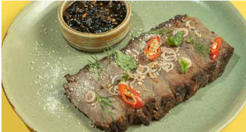
Grilled Thai Wagyu Beef Flank 'Tiger Cry'