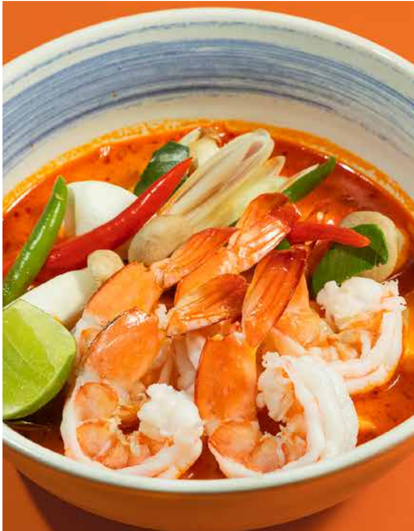
Tom Yum Prawn ต้มยำกุ้ง 380 Tom Yum Seafood ต้มยำทะเล 380 seasonal mushroom, sour tomato, chili paste and coconut milk เห็ดตามฤดูกาล มะเขือเทศ พริกเผา และกะทิ