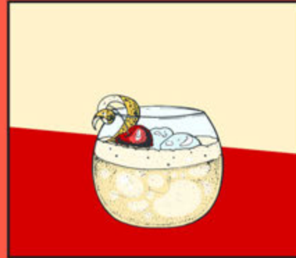
Whiskey Sour 350

Bourbon, Lime Juice, Syrup, Egg White, Angostura Bitters