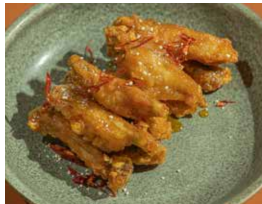
Deep-Fried Single Bone Chicken Wing