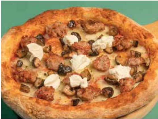
Salsiccia 420 Italian sausage, sauté mushroom, Ricotta cheese พิซซ่าซาลซิกเซีย ไส้กรอกอิตาลี เห็ด และชีสริคอตต้า