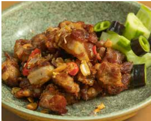
Deep - Fried Fermented Pork Ribs 280 with purple chili & cucumber