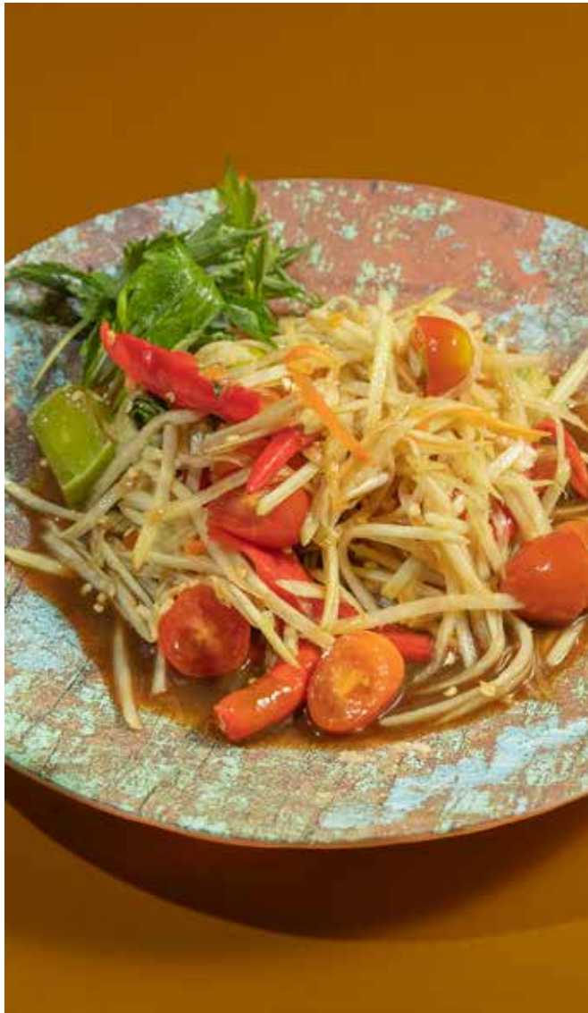
Som Tum Papaya ส้มตำมะละกอ