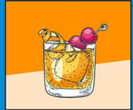
Old Fashioned 360

Bourbon, Lime Juice, Syrup, Egg White, Angostura Bitters