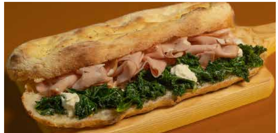
Mortadella 420 Romana Pala style, Mortadella ham, Stracciatella, marinated curly kale พิซซ่ามอร์ตาเดลล่า พิซซ่าสโตนโรมาเนอพาลา แฮมมอร์ตาเดลล่า ชีสสตราเซียเตลล่า และผักเคลดอง