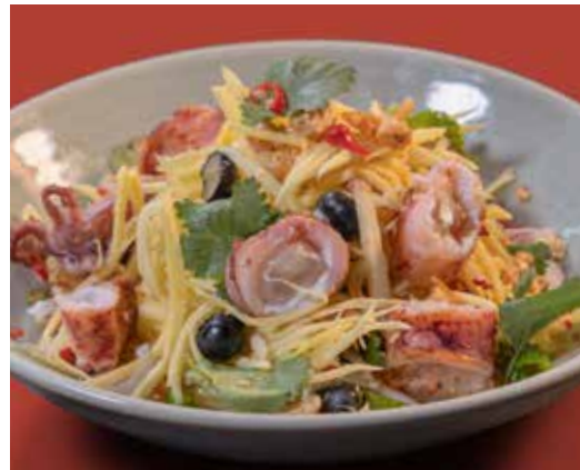
Green Mango Salad 280 with grilled calamari