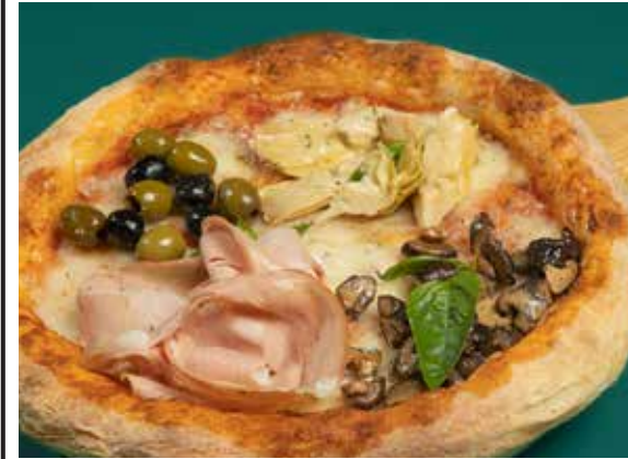
Capricciosa 400 artichoke, sauté mushroom, Italian cooked ham, mixed olives พิซซ่าคาปริซิโอซา อาร์ติโชค เห็ด อิตาลีแฮม และมะกอก