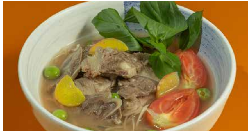
Beef Run Juan 350 with sour tomato, shrimp paste, herbs and chili แกงรัญจวนเนื้อ มะเขือเทศ กะปิ สมุนไพร และพริก