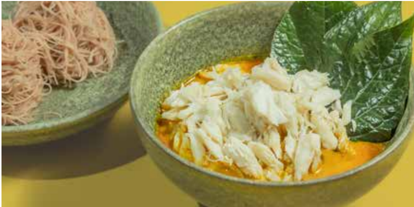
Yellow Crab Curry blue crab meat cooked with betel leaf, served with rice noodle