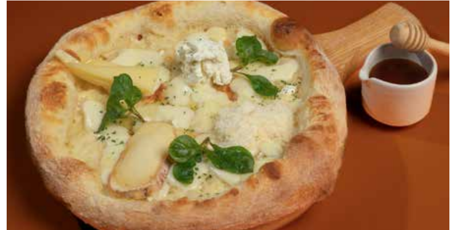
Quattro Formaggi 450 four cheese pizza with honey & watercress salad พิซซ่าควัตโตร พอร์มาจจิ ชีส 4 ชนิด เสริฟพร้อมน้ำผึ้ง และสลัดวอเตอร์เครส