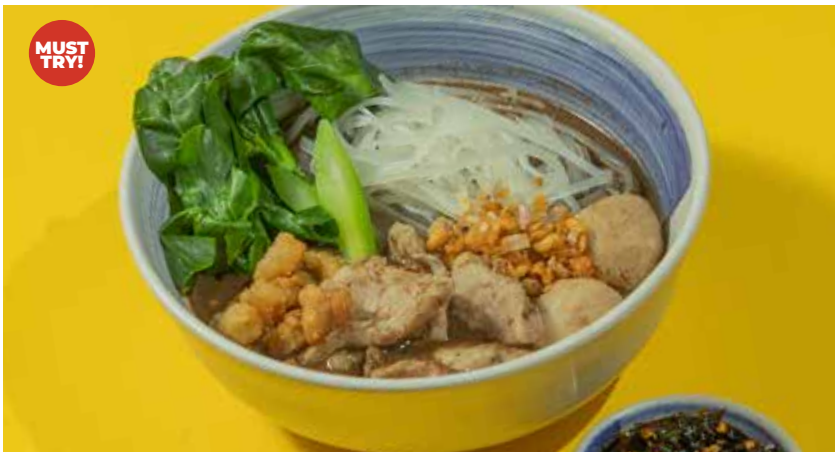
Isan Boat Noodle Isan specialty, spicy pork noodle cooked in blood soup

ก๋วยเตี๋ยวเรือสไตส์อีสาน ก๋วยเตี๋ยวหมูน้ำตกต้นตำรับและลูกชิ้น