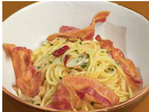
Spaghetti AOB 280 garlic, olive oil, bacon, chili and Italian parsley

สปาเกตตี คาร์บอนาร่า โรมาน่า ไข่แดง ชีสเพคอรินโน่ และเบคอน