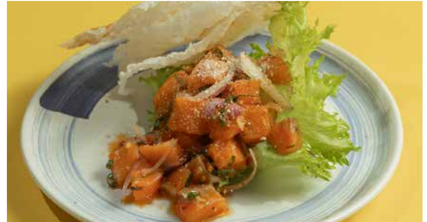
Larb Salmon served with rice cracker & organic watercress