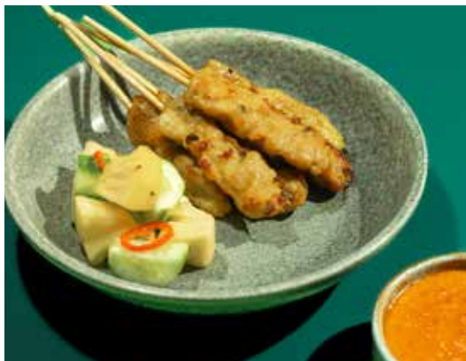
Grilled Chicken Satay