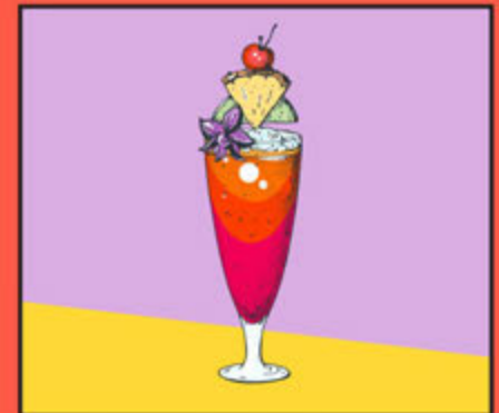
Singapore Sling 360

Dry Gin, Benedictine, Heering cherry, Cointreau, Pineapple Juice, Lemon Juice, Angostura Bitters, Grenadine