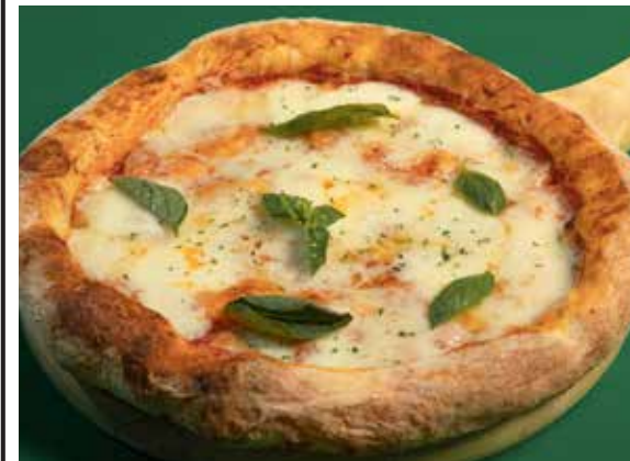
Margherita 350 tomato Pomodoro, Mozzarella cheese, Italian basil พิซซ่ามาร์เกอริต้า มะเขือเทศโพโมโดโร ชีสมอสซาเรลล่า และโหระพา